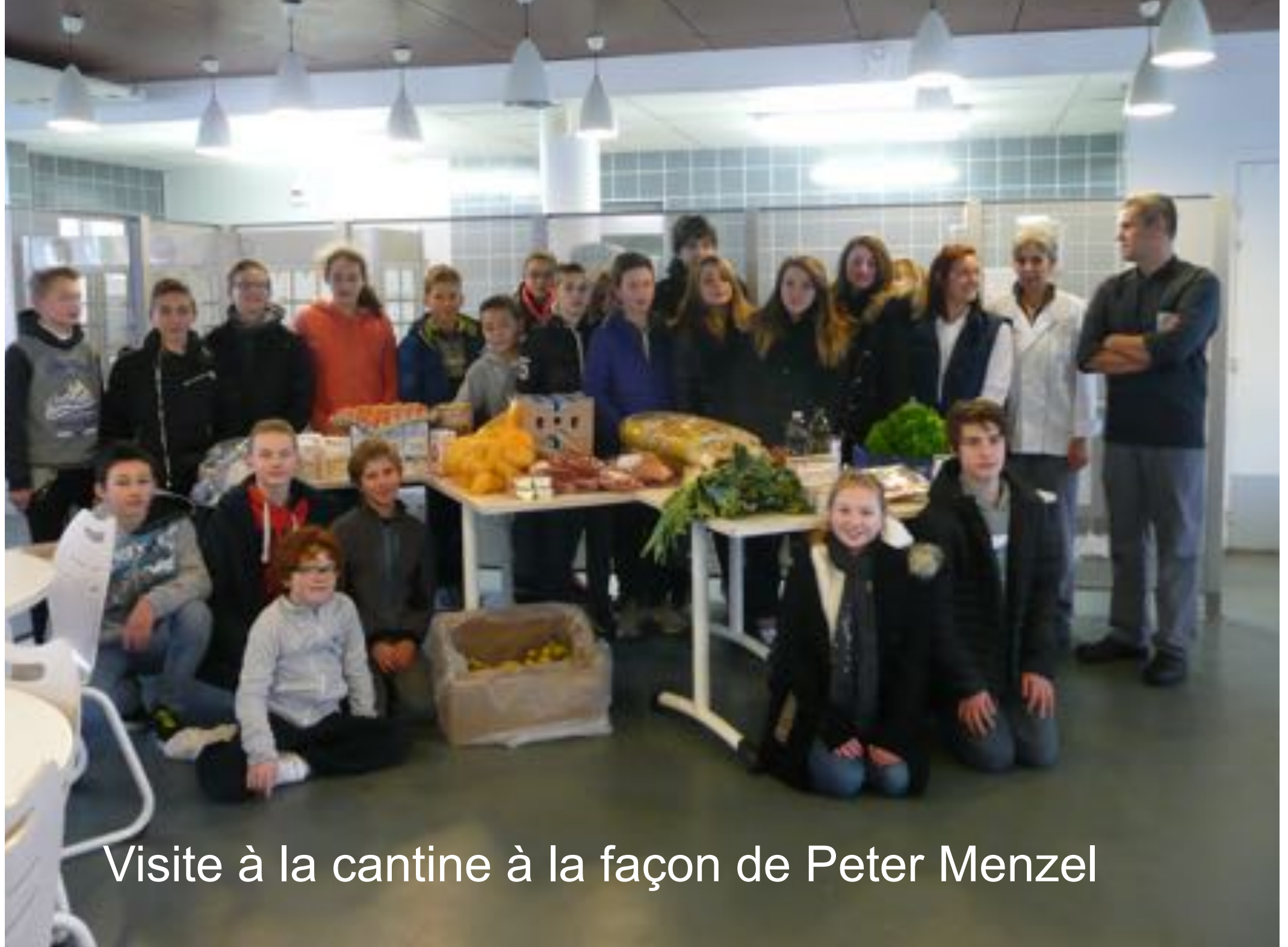
Visite à la cantine à la façon de Peter Menzel